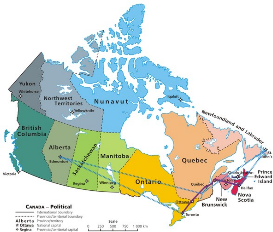
M. 1: Route of the trip on the map of Canada / Trasa podróży na mapie Kanady